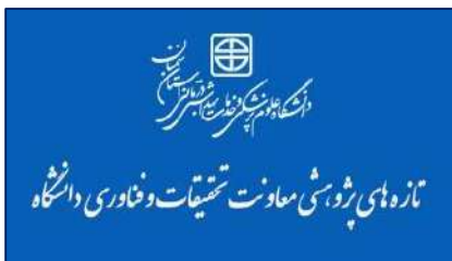
تازه های پژوهشی / توجه به مشکلات رفتاری انطباقی در کودکان و نوجوانان با فلج مغزی ضروری است ۱۴۰۲/۰۲/۰۵