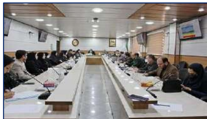
ششمین جلسه کارگروه سلامت و امنیت غذایی استان سمنان برگزار شد ۱۴۰۲/۰۲/۲۷