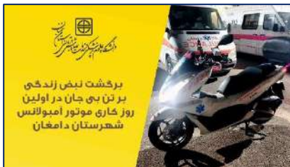
احیای موفق در اولین روز کاری موتور آمبولانس در اورژانس پیش بیمارستانی شهرستان دامغان ۱۴۰۲/۰۲/۰۷