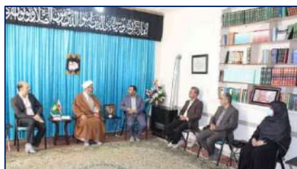
دیدار مدیر شبکه بهداشت و درمان و سرپرست بیمارستان ولایت با امام جمعه معزز دامغان به مناسبت هفته سلامت ۱۴۰۲ ۱۴۰۲/۰۲/۱۶