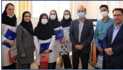
بزرگداشت روز علوم آزمایشگاهی در شبکه بهداشت و درمان شهرستان گرمسار ۱۴۰۲/۰۲/۰۵