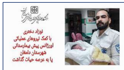
نوزاد دختر با کمک نیروهای عملیاتی اورژانس پیش بیمارستانی پا به عرصه حیات گذاشت ۱۴۰۲/۰۲/۰۸