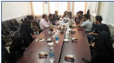
بازدید معاون دانشجویی و فرهنگی دانشگاه از دانشکده های تغذیه و علوم غذایی آرادان ۱۴۰۲/۰۲/۱۳