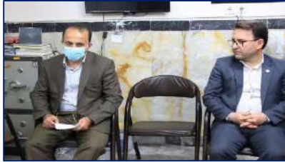
دیدار مدیر شبکه بهداشت و درمان شهرستان گرمسار با امام جمعه این شهرستان در هفته سلامت ۱۴۰۲ ۱۴۰۱/۰۲/۱۲