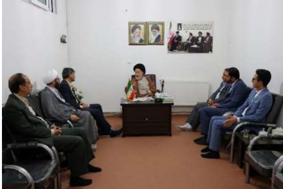
از اسامی و نام خیرین هم جهت گسترش فرهنگ خیر و وقف درمانی استفاده شود.

پزشکی خانواده را بسیار سودمند و مفید دانست و اجرای درست آن را باعث افزایش رضایت مندی مردم عنوان کرد حضرت آیت الله شاهچراغی بیان نمود: تلاش برای افزایش نسل و جوان شدن نیروی انسانی کشور سیاستی حیاتی و از ضروری ترین فرائض می باشد که مورد تاکیدمقام معظم رهبری نیز قرار گرفته است که لازمست مورد توجه مردم و مسئولان قرار گیرد. وی با بیان توصیه های اخلاقی، کار و تلاش در عرصه بهداشت و درمان و خدمت صادقانه به مردم را ارزشمند خواند و افزود: در سطح استان سمنان برای امور درمانی و بهداشتی می توانید از خیرین بهرمنند شوید و حتی