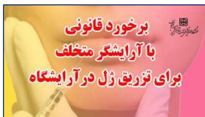
پلمب یک آرایشگاه متخلف در شهرستان گرمسار ۱۴۰۱/۰۲/۱۶