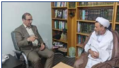
دیدار مدیر شبکه بهداشت و درمان شهرستان مهدیشهر با امام جمعه این شهرستان ۱۴۰۲/۰۲/۱۳