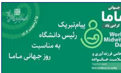
پیام تبریک رئیس دانشگاه به مناسبت روز جهانی ماما ۱۴۰۲/۰۲/۱۴