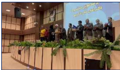
گرامیداشت روز کارگر در بیمارستان ولایت دامغان ۱۴۰۲/۰۲/۱۲