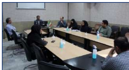
اولین جلسه برنامه پزشکی خانواده و نظام ارجاع در مناطق شهری دامغان برگزار شد ۱۴۰۲/۰۲/۲۳