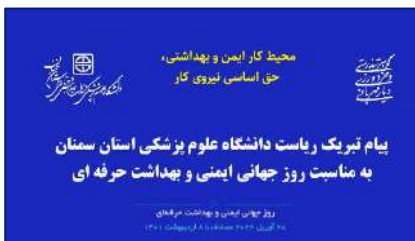
پیام تبریک رئیس دانشگاه به مناسبت روز جهانی ایمنی و بهداشت حرفه ای ۱۴۰۲/۰۲/۰۸